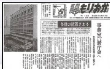
▲行財政の資料（広報もりおか 昭和37年10月15日号）

市政と市民の関わりを描くため、参政権、功労者、戦後復興から現代に至るまでの盛岡市政のあゆみや、議会の活動について取り上げます。また、合併前の都南村と玉山村についても詳しく取り上げ、その後の各章につながる政策的な枠組みを示していきます。